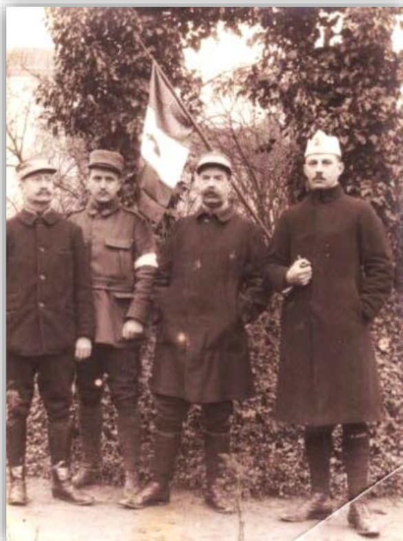
Groupe d'officiers français, en 1915, portant le drapeau tricolore orné du Sacré-Cœur.

Pendant la Grande Guerre, le drapeau tricolore ne peut plus être contesté par les combattants catholiques et c'est ainsi que certains d'entre eux vont le christianiser en plaçant le Sacré Cœur sur la bande blanche centrale. En raison des tourments liés à la guerre, les catholiques de France cherchent consolation auprès du Sacré Cœur. Dès 1915, la dévotion se diffuse sur l'ensemble du front auprès des soldats avec un énorme engouement pour toutes sortes d'objets à caractère religieux.