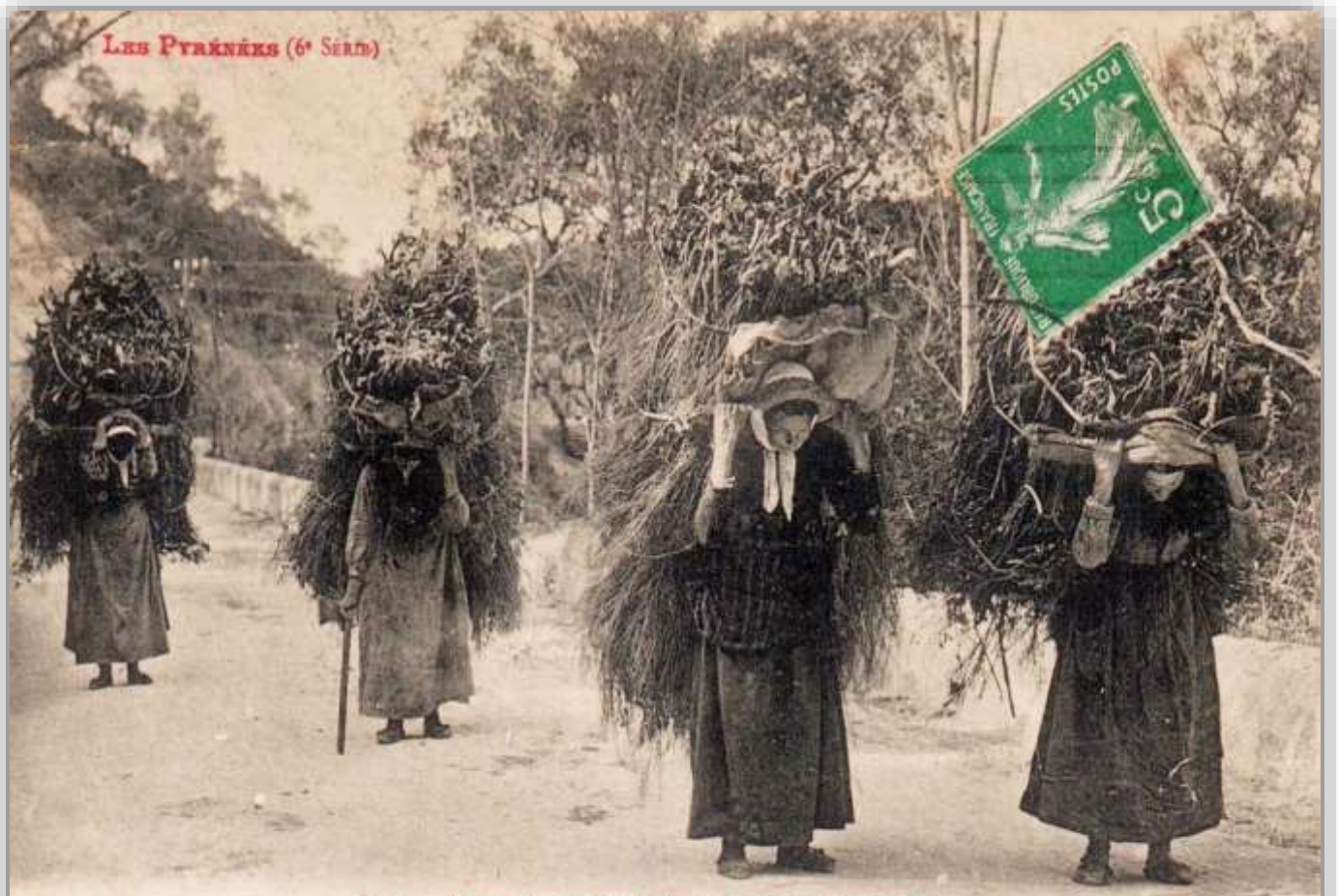
281. - FEMMES DESCENDANT LE BOIS DE LA MONTAGNE