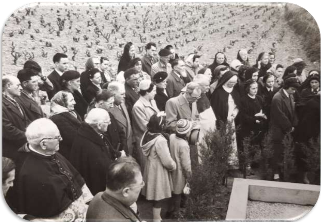
« Archives Diocésaines de Perpignan – 190 CP »