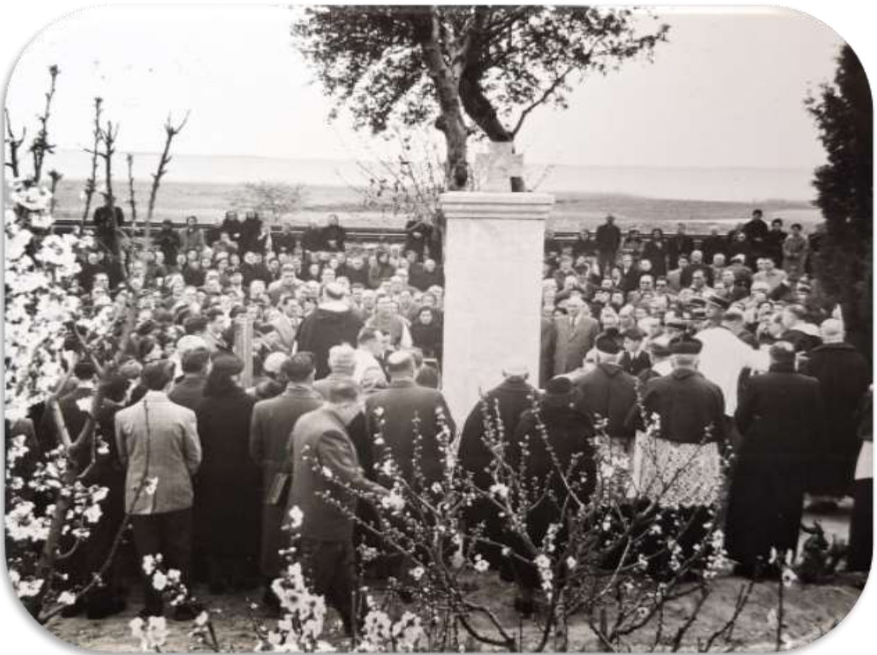
Les lieux sont bien différents d'aujourd'hui, la Route Nationale 9 était bordée de platanes, qui furent fatals au père Suarez, et à la place de l'autoroute A9 se trouvaient des vignes