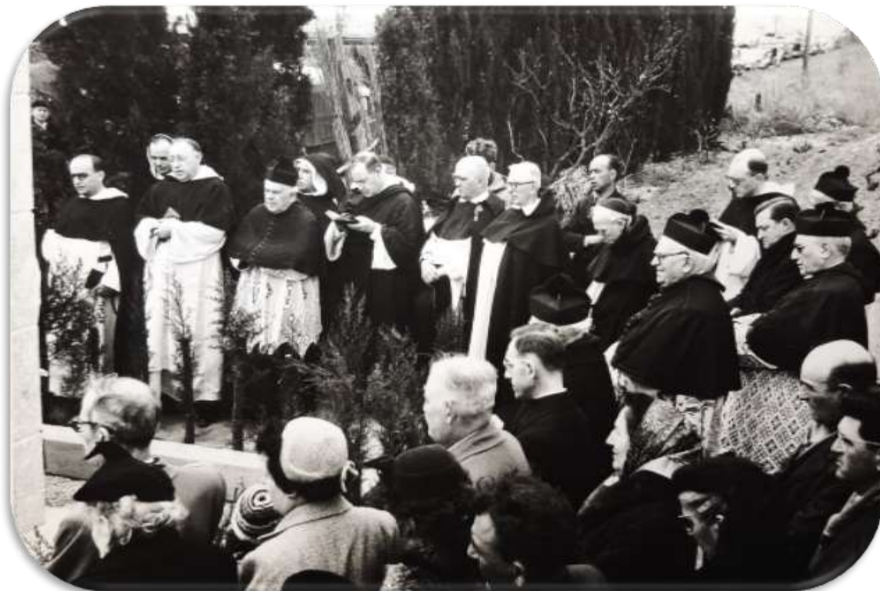
« Archives Diocésaines de Perpignan – 190 CP »