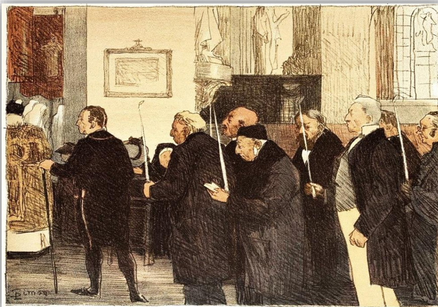
« Les Marguilliers »

A l'origine, c'était une assemblée de clercs auxquels se sont ajoutés, depuis le Concile de Trente, des laïcs, chargés de l'administration des biens de la communauté paroissiale. Au sein d'une paroisse le conseil de fabrique est, jusqu'en 1905, date de sa suppression, un ensemble de personnes (religieux et laïcs), chargé de collecter les fonds et revenus servant à la construction des églises et des édifices religieux, ainsi qu'à leur entretien et celui du mobilier. Aujourd'hui on le nommerait conseil d'administration.